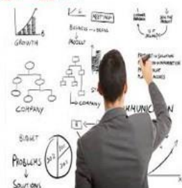
اختراعات و ابداعات