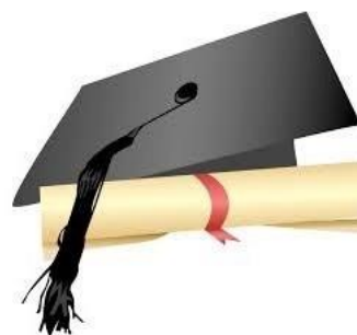
پایان نامه ها