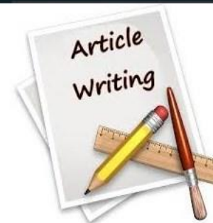
مقالات ارائه شده

پژوهشگران محترم مرورگرهای FireFox و Chrome جهت بهره برداری بهینه پیشنهاد می گردد.