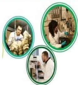
فعالیت های متفرقه