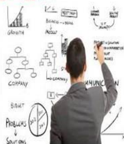
اختراعات و ابداعات